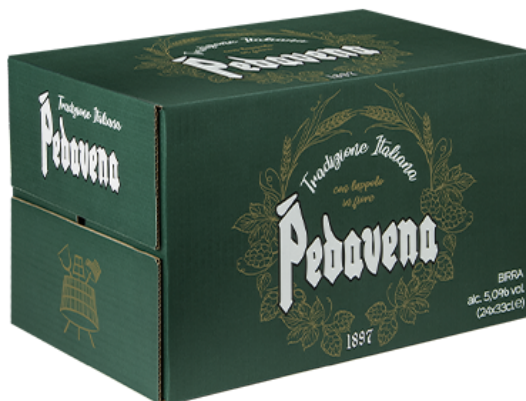
Imballo secondario cartone Codice EAN 8023400106532