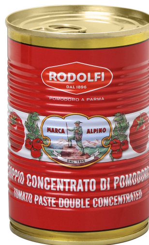
Immagine Prodotto - Product Image

Nomenclature doganale 20029039 Custom Code