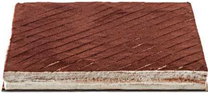
Immagine a scopo illustrativo