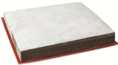
Immagine a scopo illustrativo