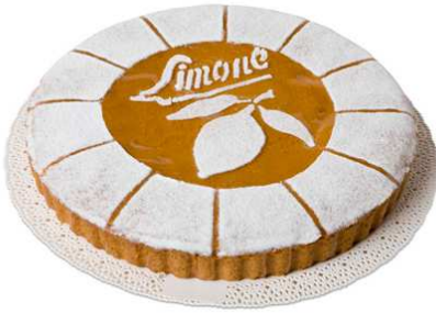
Immagine a scopo illustrativo