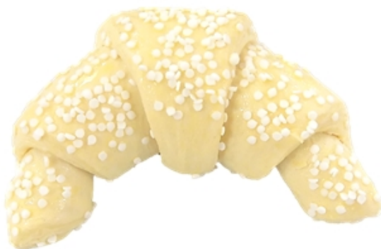
Foto Prodotto Cotto