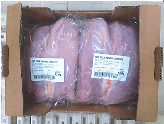
(inserire foto con pezzi nel cartone aperto)