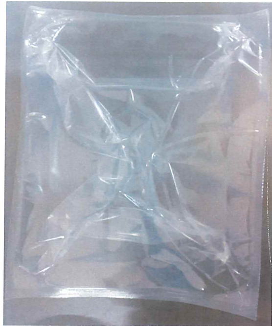
(Inserire foto pack primario)