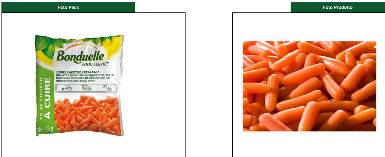
Foto del prodotto

Ragione Sociale del Venditore (Operatore del settore alimentare Responsabile delle Informazioni) Bonduelle Italia S.r.l. - Via Trento - 24060 S.Paolo D'Argon (BG) - Italia