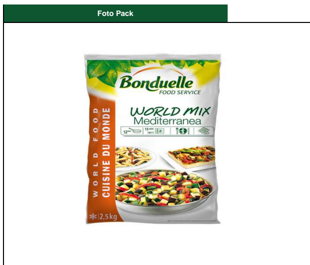
Foto del prodotto