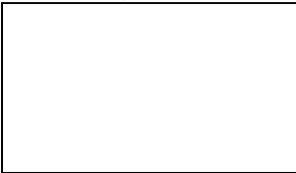
ETIQUETA DE LA CAJA